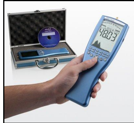
נתוני מכשיר אארוניה:

מכשיר מדויק בעל רגישות גבוהה, טווח מדידה רחב ויכולת לאגור נתונים.